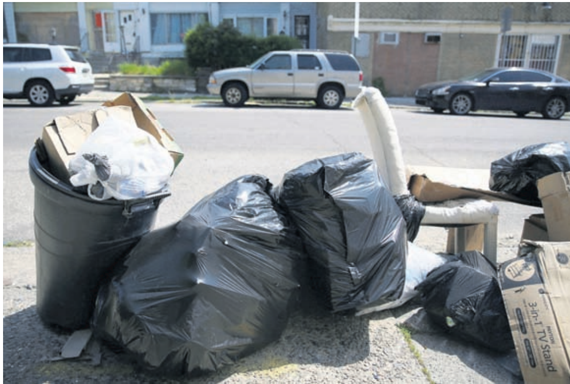
Bags of garbage sit along the street before being picked up in Philadelphia's Ogontz section in this file photo from May 13, 2020.

Faced with social distancing restrictions, residents are staying home and generating more trash than ever before — about a 30% increase in residential trash collections, said Streets Commissioner Carlton Wil-